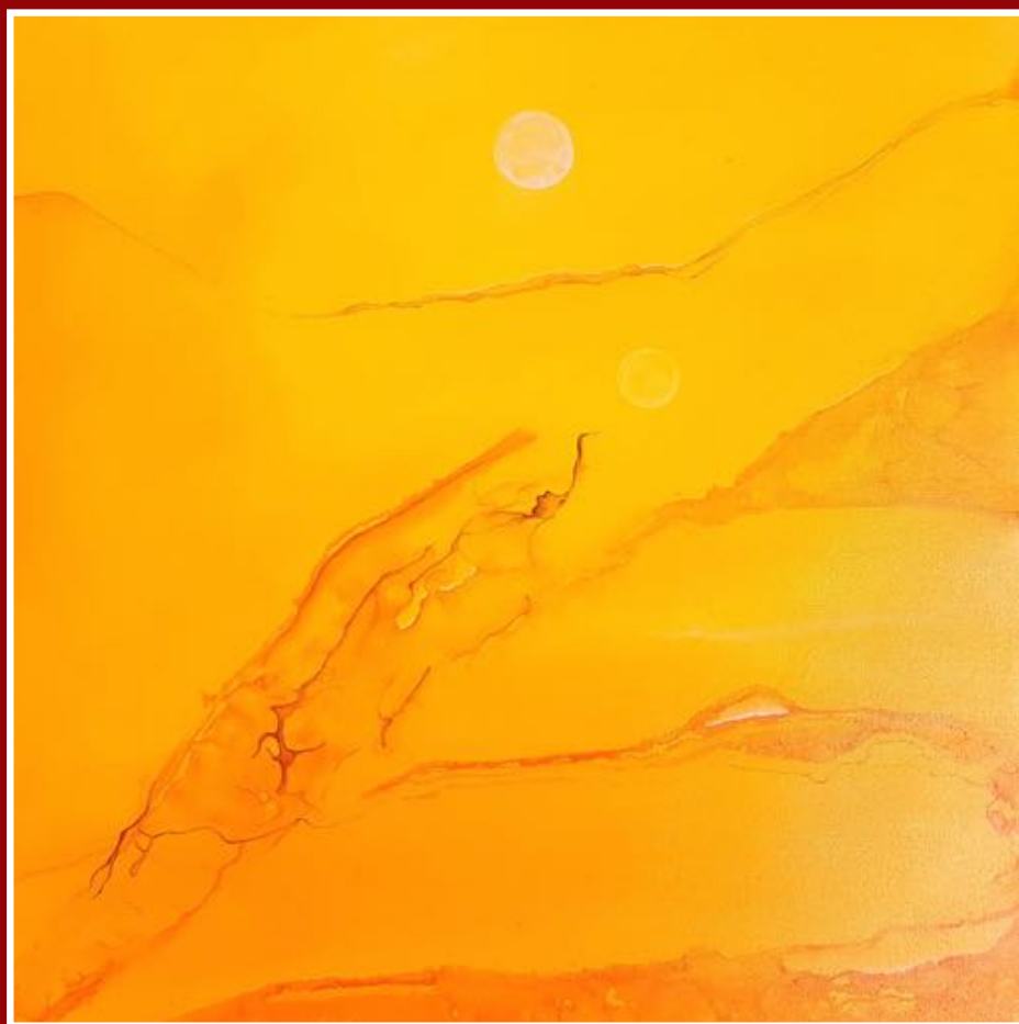
Mélanie GILLIAND peintures